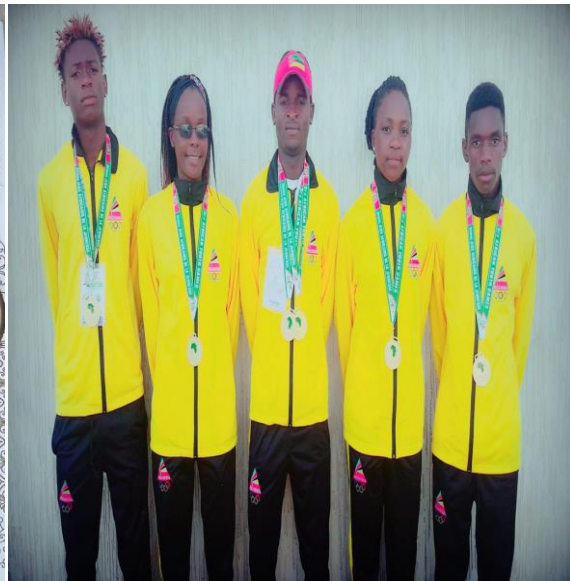
Medalhas e certificado dos atletas.